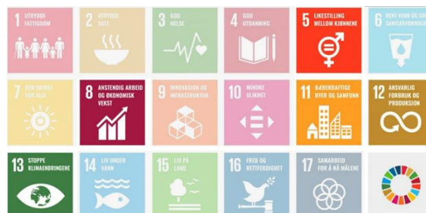
Figur 1: FNs bærekraftsmål

Prioriteringen illustrerer hvor OBOS har størst mulighet til å påvirke samfunnet i en mer bærekraftig retning. Utvelgelsen er gjort i forbindelse med konsernets vesentlighetsanalyse, som setter en strategisk retning for OBOS sitt bærekraftsarbeid.